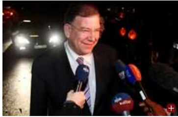
Kurz vor dem vierstündigen Kulturgipfel: Hamburgs Erster Bürgermeister Christoph Ahlhaus (CDU)

29. Oktober 2010 Christoph Ahlhaus, gebürtig aus Heidelberg, Baden-Württemberg, Bankkaufmann, Jurist und CDU-Politiker, hat irgendwann Anfang vergangener Woche offenbar für sich beschlossen, doch nicht den Mappus zu machen. Der Erste Bürgermeister der Freien und Hansestadt Hamburg will es dem Parteifreund und Ministerpräsidenten seines Geburtslandes nicht gleichtun und in die Geschichte eingehen als ein erst durch Rücktritt seines gewählten Vorgängers ins Amt gekommener Landesfürst, der strammen Schrittes und sehenden Auges in den politischen Untergang marschiert.