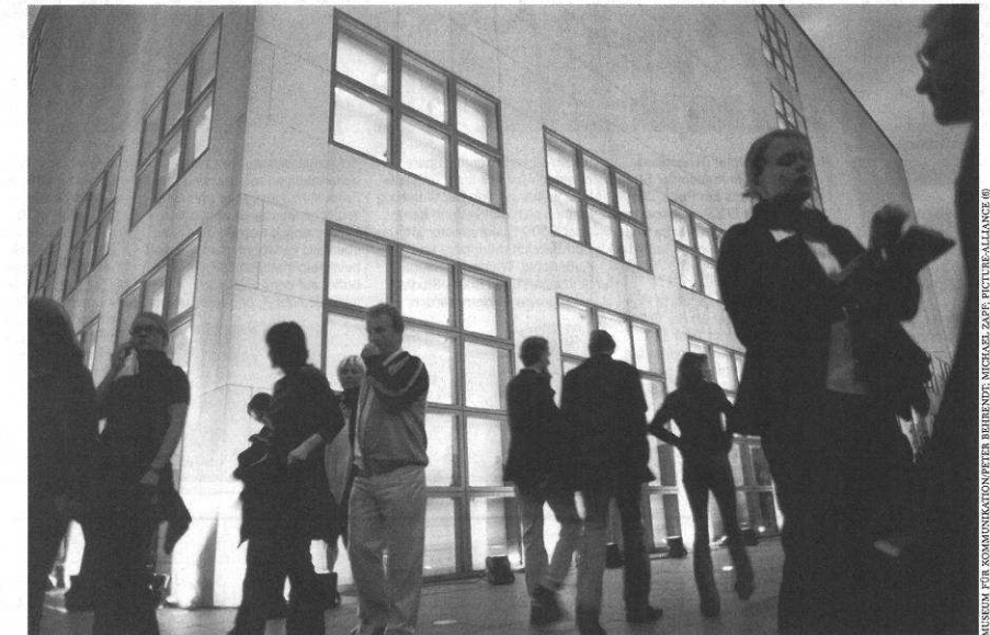
Museumsbesucher vor der zur Kunsthalle gehörenden Galerie der Gegenwart bei der „Langen Nacht der Museen“